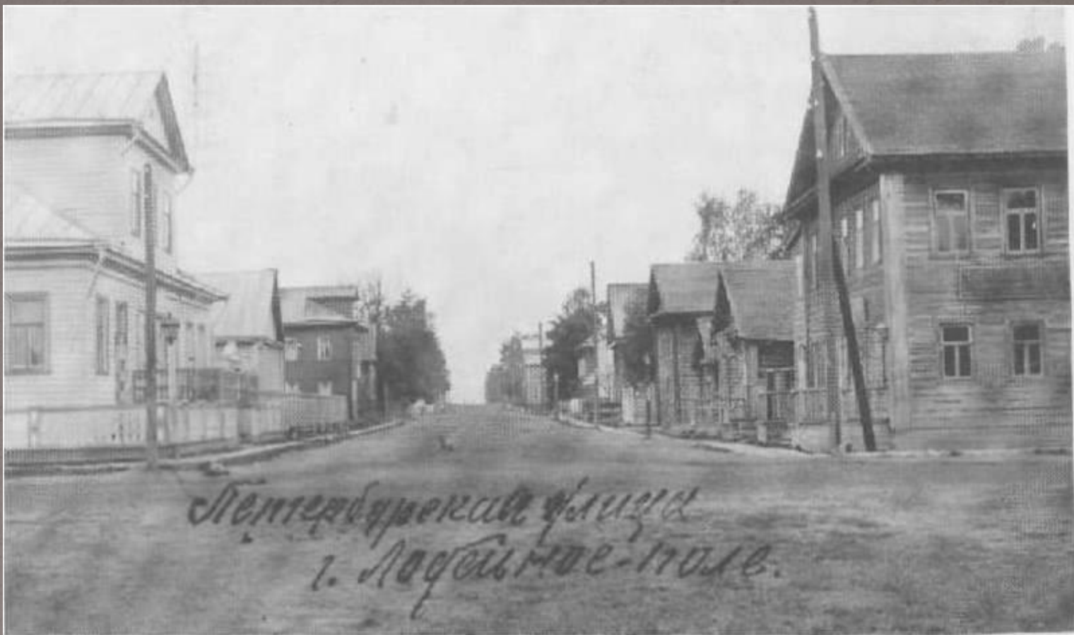
Лодейное Поле на грани веков