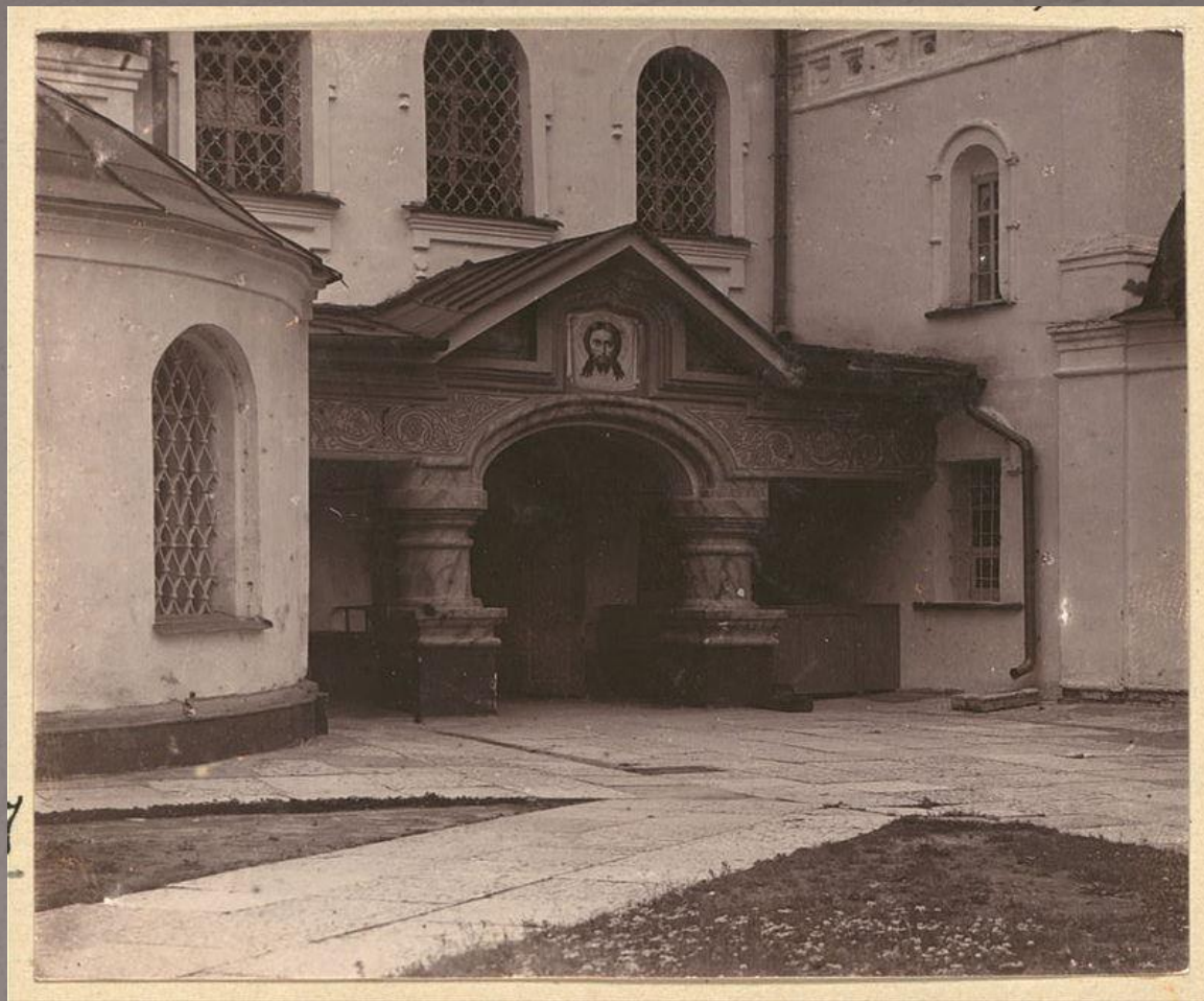
Александрo-Свирский монастырь. Фото С. М. Прокудина-Горского, 1909 г.