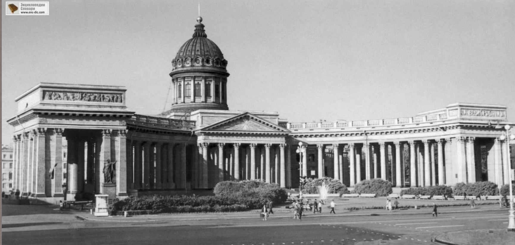
Собор Иконы Казанской Божьей Матери, СПб.