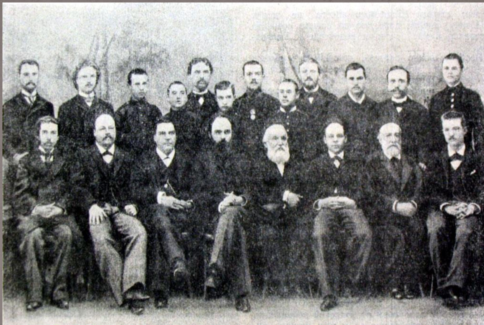
Преподаватели и ученики регентских классов. Фото конца XIX в.