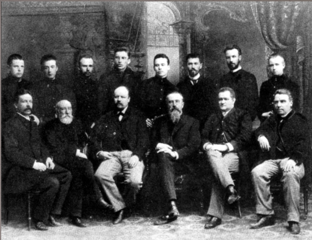
Педагоги и ученики инструментальных классов