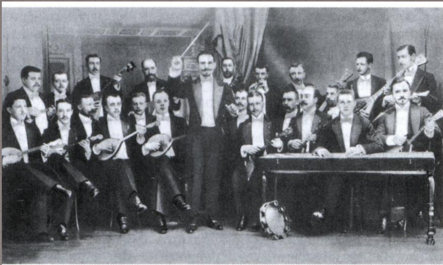
Великорусский оркестр В. В. Андреева. Фото нач. 1900-х гг.