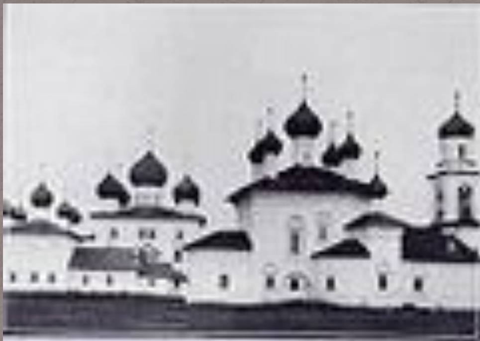
Торговая площадь г. Каргополя в 1901 г.