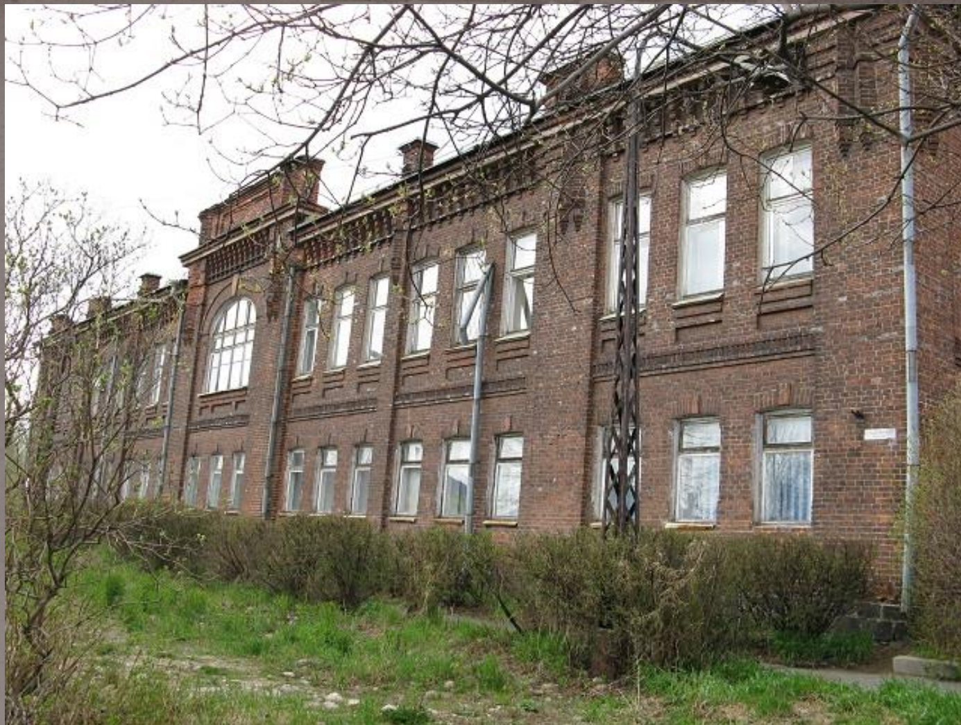
Здание Петрозаводской учительской семинарии